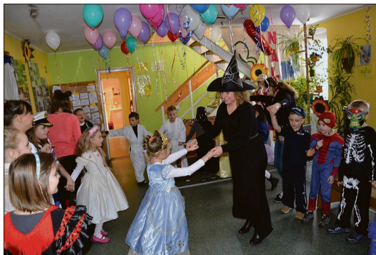
Zabawa u harcerzy na zakończenie ferii zimowych

Pomimo że całkowite koszty ferii są jeszcze liczone, już wiadomo, że wydano blisko 17,4 tys. zł (w tej kwocie nie uwzględniono kosztów wolontariatu, które przedstawia się we wniosku o dofinansowanie – wyniosłyby 3 tys. zł).