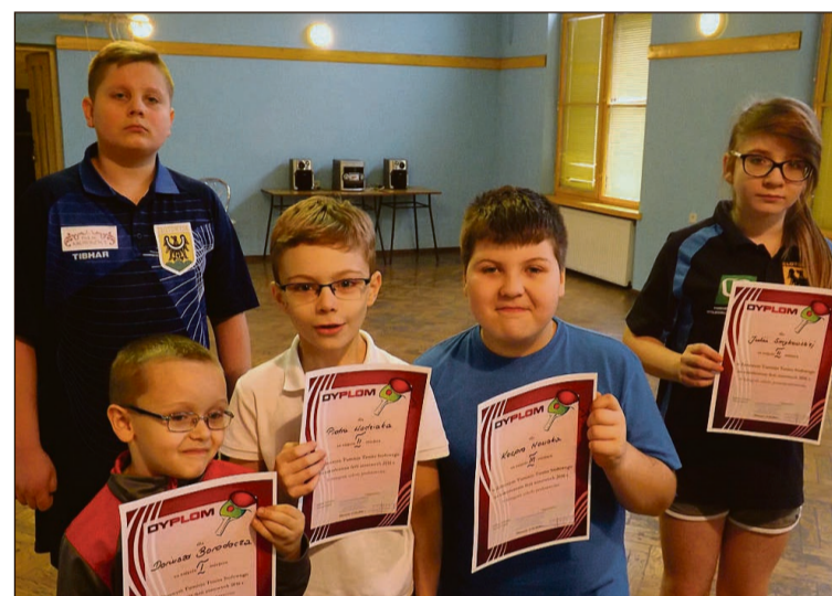
Finałiści turnieju na zakończenie ferii