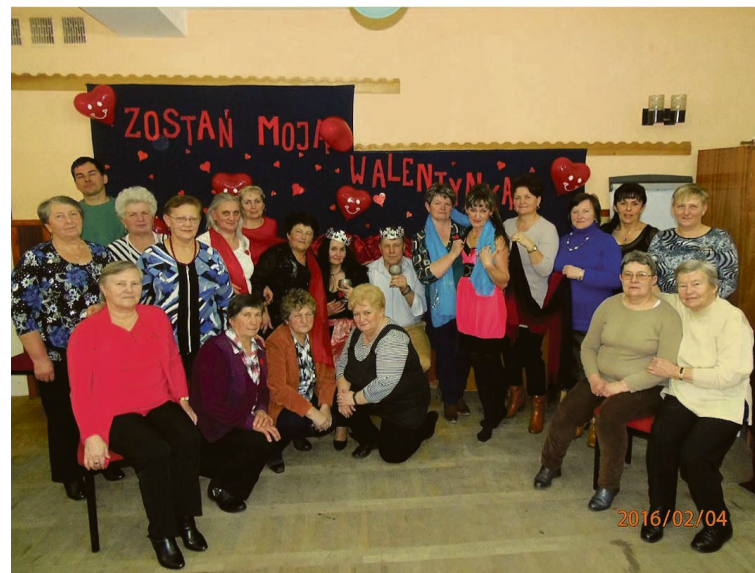
Uczestnicy waleńkowo-karnawałowego spotkania