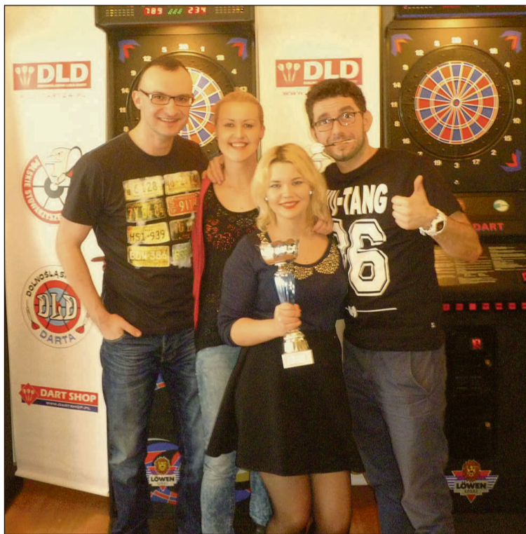
Fura Dart w pełnym składzie