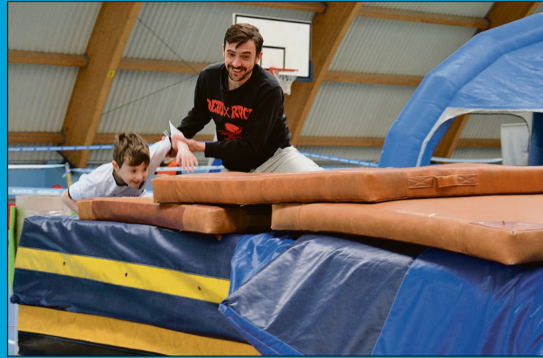
Jak tato pomoże...