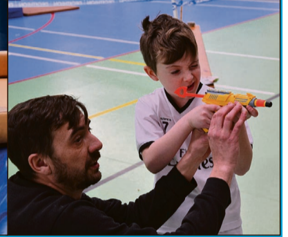
...to i oko celniejsze