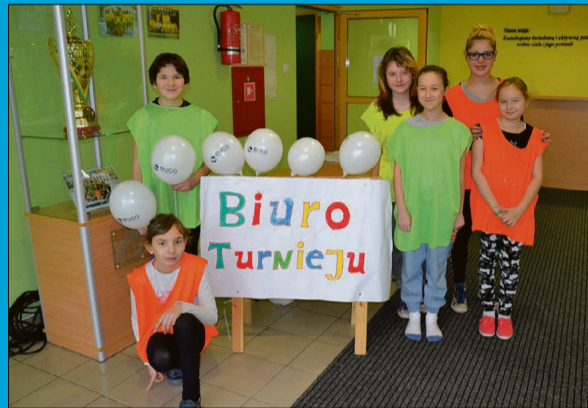
Uczestników w hali witają uśmiechnięte buzie dzieci

rzuty piłeczkami oraz odpowiedzi na pytania zadawane w „strefie edukacyjnej”. Na koniec każdy z duetów musiał ułożyć słowo z liter, które otrzymywał tuż przed metą. Wszystkie słowa były związane z rodziną. Mieliśmy więc „ciepło”, „radość”, „wychowanie” czy „rodzeństwo”.