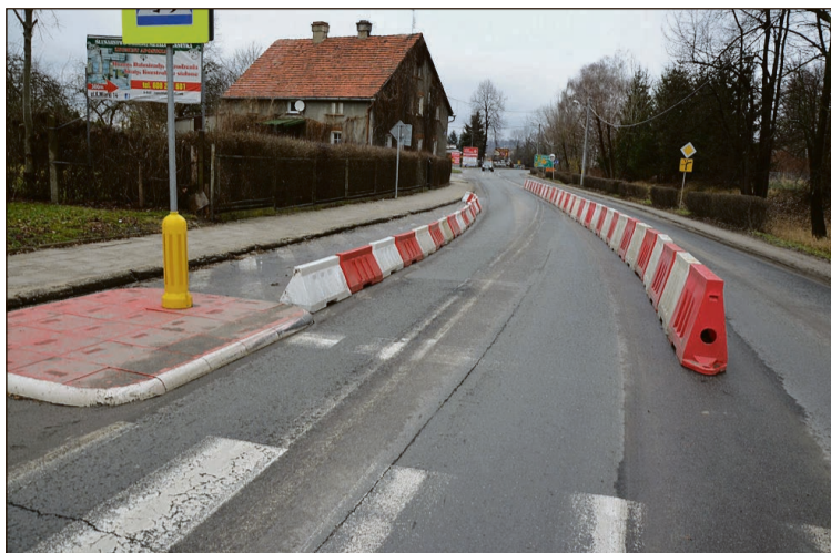
Linie wymalowane w grudniu są już niewidoczne. Na asfalcie przebijają natomiast stare oznakowanie

By zwiększyć widoczność pieszych, DSDiK zaprojektowała od wewnętrznej strony łuku boczny azyl dla pieszych – coś w rodzaju cypla wysuniętego w kierunku osi jezdni. Oś została natomiast przesunięta tak, aby zachować prawidłową szerokość pasa ruchu, tj. 3,5 m. Dodatkowo zaprojektowano linię krawężniową wraz z elementami odbłaskowymi, która ma na celu wskazać krawędź pasa ruchu, a sam azyl miał być dodatkowo oznakowany żółtymi pylonami, nad którymi zamontowano znaki informujące o przejściu na żółtym tle fluoroscencyjnym.