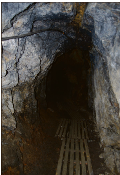
Złotoryi „Aureus Mons”.