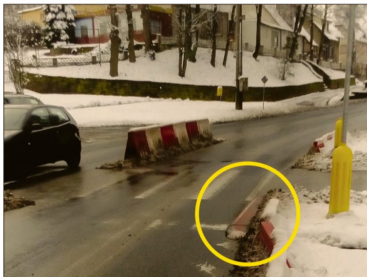
Plastikowe wyгородzenia to elementy, które lubią się przesuwac po jezdni, więc... w okolicach przejścia nadal warto zachować szczególną ostrożność, bo może się okazać, że zza pachołka w ostatniej chwili ukaże się krawężnik azylu

mieszkańca powiatu bolesławieckiego. W samochodzie złodziei znaleziono łup w postaci m.in. koców, pościeli, obrusów oraz innych drobnych przedmiotów stanowiących wyposażenie domu. Jak się okazało, jeden z zatrzymanych mężczyzn był osobą poszukiwaną przez policję. Obaj sprawcy usłyszeli zarzuty. Wartość skradzionych przedmiotów oszacowano na kwotę ponad 1000 zł. Mężczyznom grozi kara do 15 lat pozbawienia wolności. (ask)