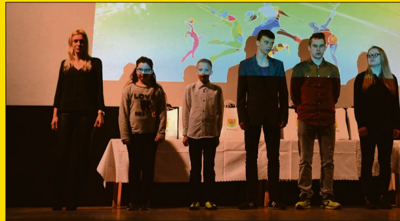
Stowarzyszenie Sportowo-Rekreacyjne „Asklepios”