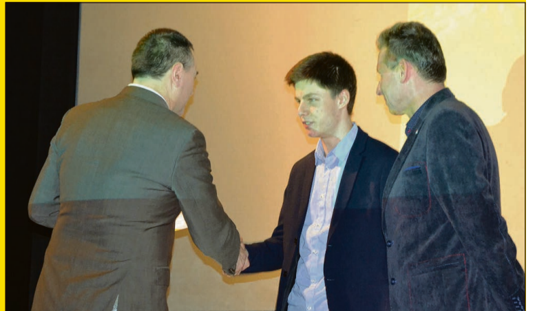
Klub Żeglarski „REDA”