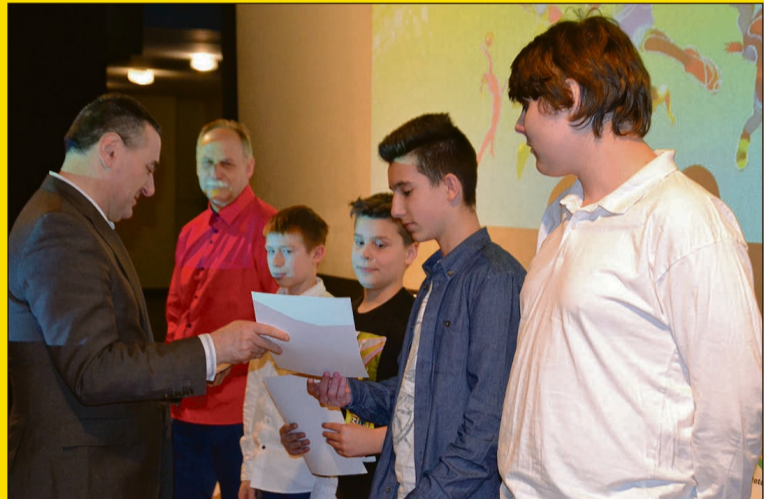
Sekcja Modelarska Złotoryjskiego Ośrodka Kultury i Rekreacji