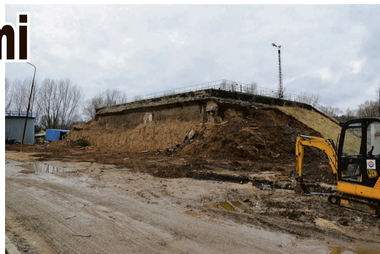
Z osadnika Imhoffa stopniowo usuwana jest skarpa ziemi