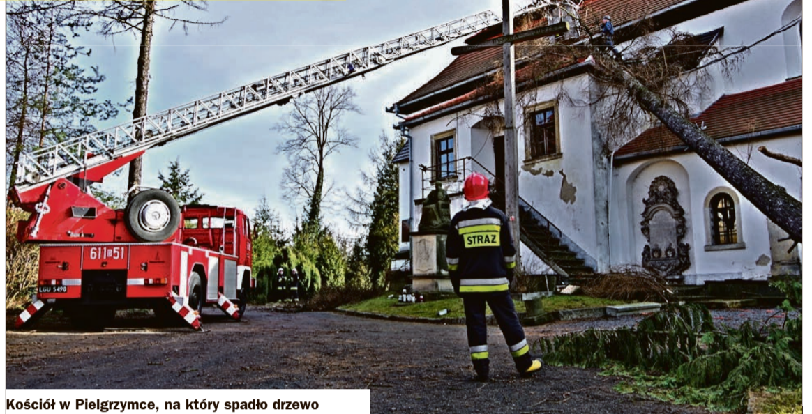
Kościół w Pielgrzymce, na który spadło drzewo

W Pielgrzymce wichura wyrządziła największe szkody. Spowodowała m.in. przewrócenie drzewa na zabytkowy kościół parafialny św. Jana Nepomucena. W jednym z budynków gospodarczych zerwała cały dach i przeniosła go ok. 100 m dalej, uszkadzając