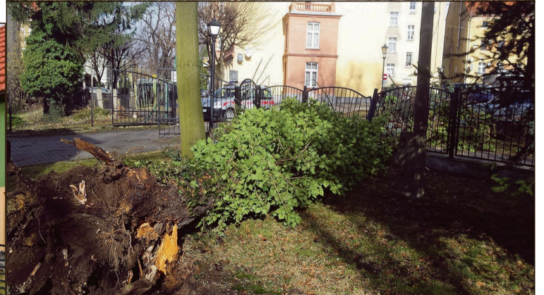
Świerk, który runął na al. Miłej