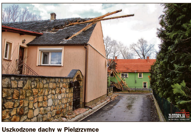
Uszkodzone dachy w Pielgrzymce