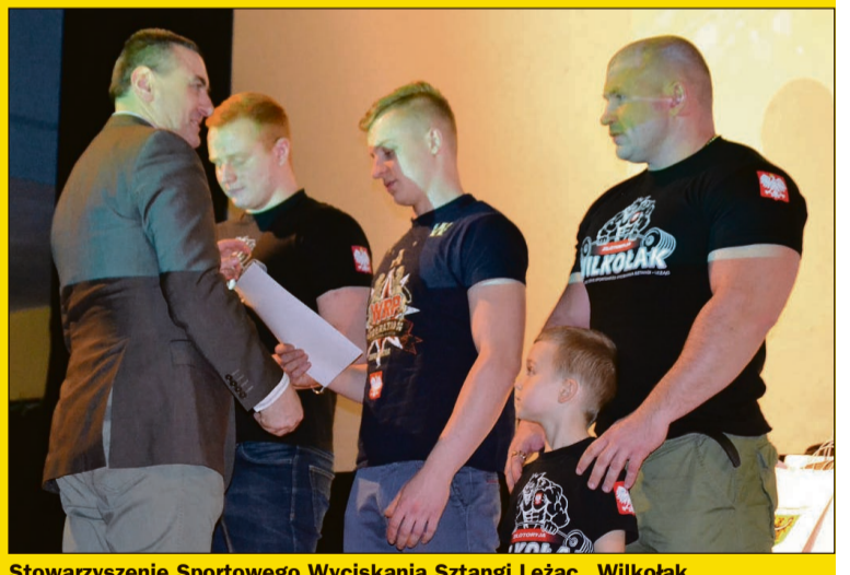
Stowarzyszenie Sportowego Wyciskania Sztangi Leżąc „Wilkołak