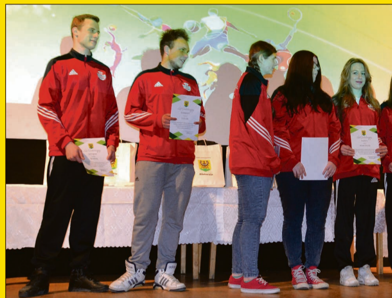
Klub Strzelecki „Agat”

Za osiągnięcia w poszczególnych dyscyplinach sportowych wyróżniono następujących zawodników: