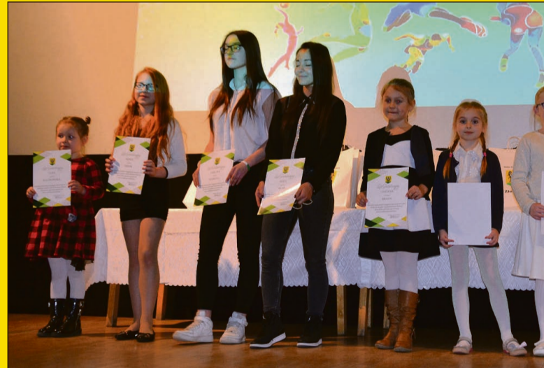
Szkoła Tańca Nowoczesnego „Wow!”