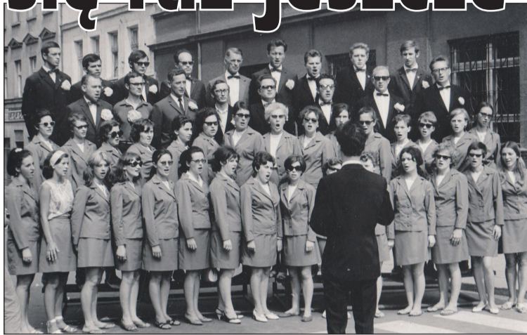
Na zdjęciu: chór ZNP w lipcu 1969 r. podczas próby przed występem na Turnieju Miast Złotoryja-Bolesławiec