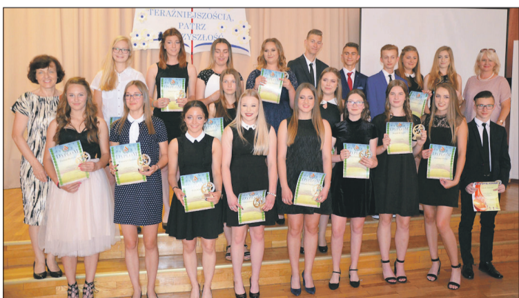
Najlepsi sportowcy z gimnazjum