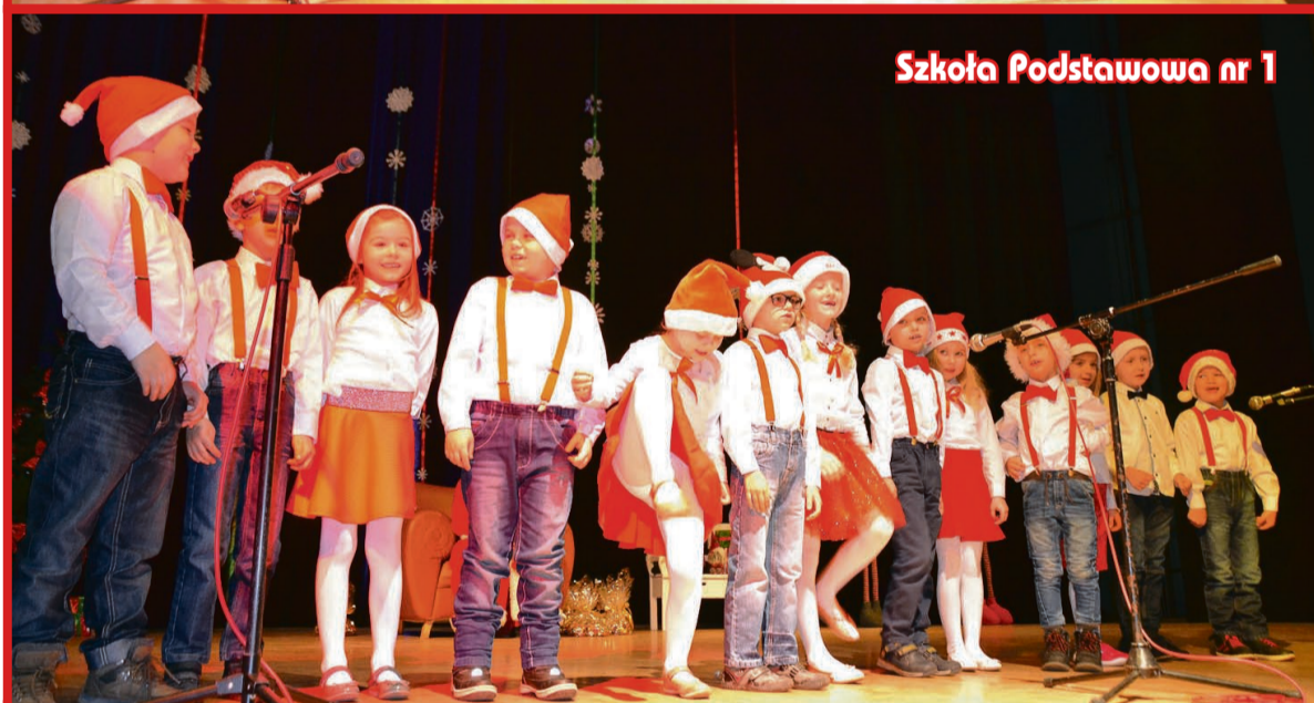
Szkoła Podstawowa nr 1