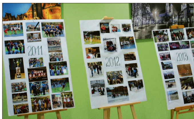
Wystawę fotograficzną nt. 10-lecia Ren Butu można oglądać w hali „Tęcza”