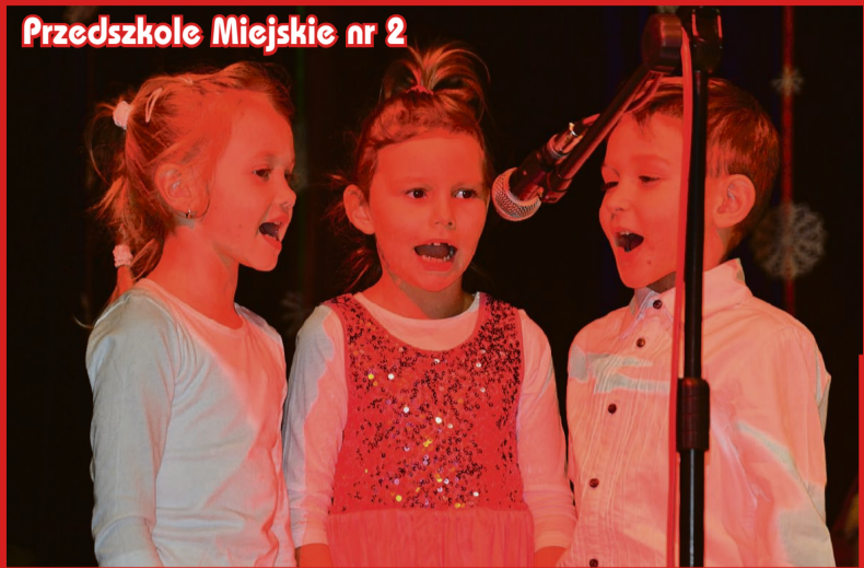
Przedszkole Miejskie nr 2