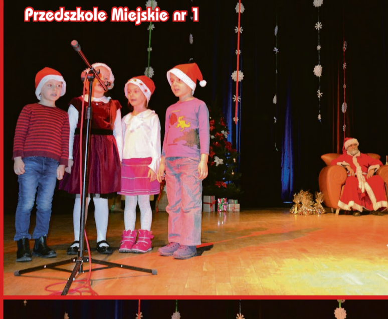
Przedszkole Miejskie nr 1