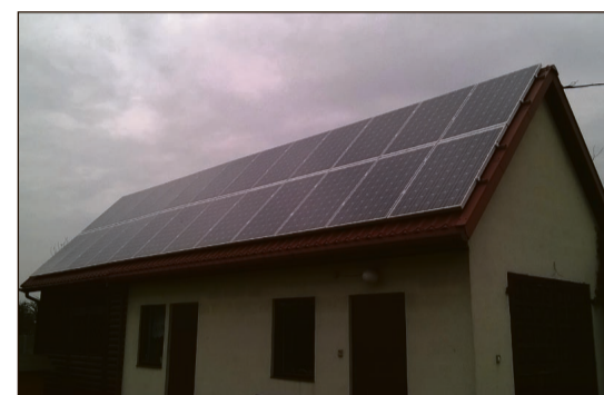
Panele słoneczne