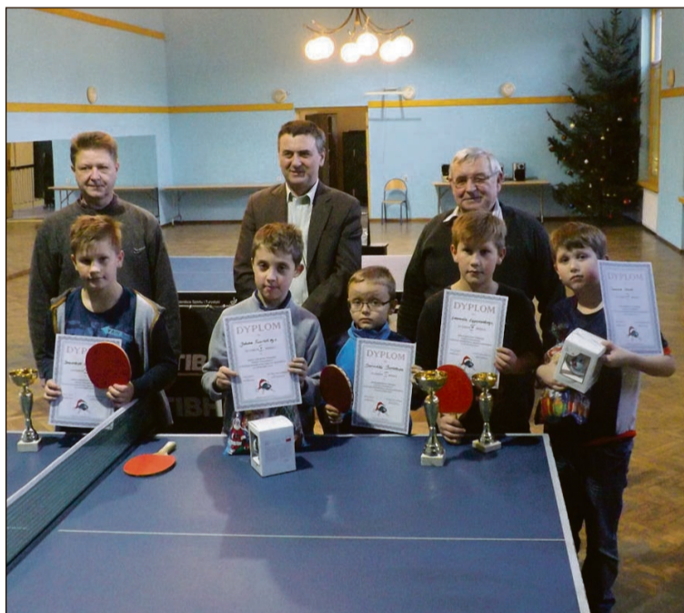
Tryumfatorzy turnieju z organizatorami