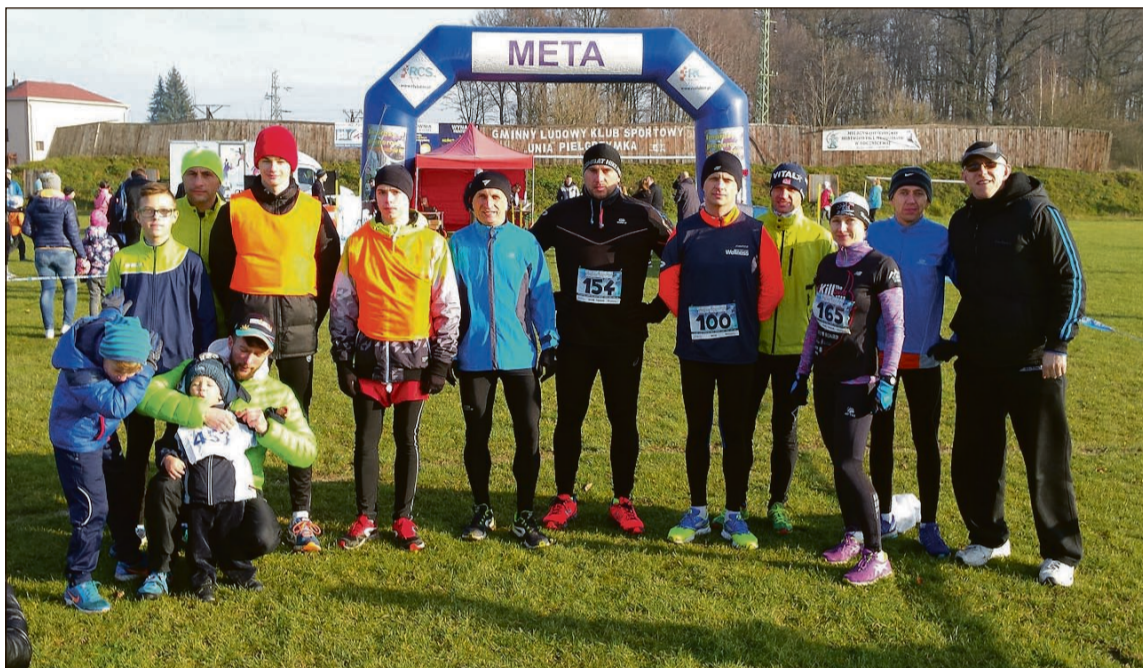
Zadowoleni ze startu w Pielgrzymce olawsowicze