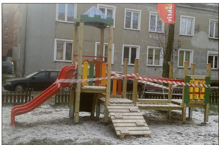
„Mała forteca” na podwórku przy Słonecznej