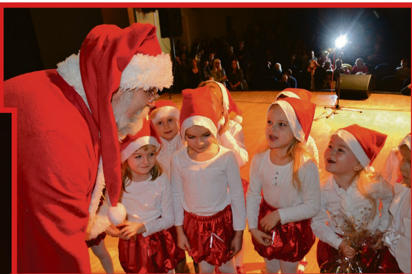
Przedszkole Miejskie nr 2