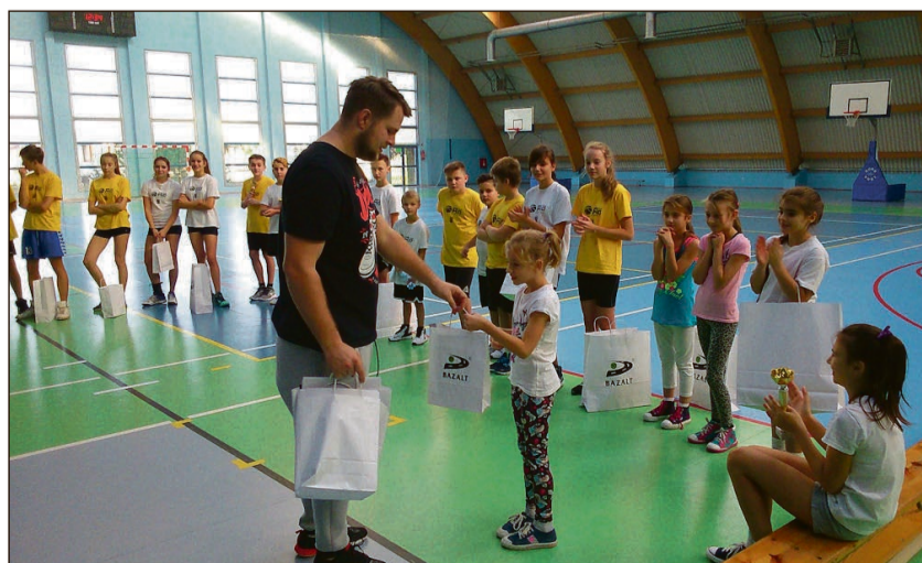
Nagrody dla uczestników turnieju