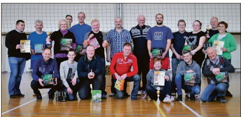
Uczestnicy turnieju siatkarskiego