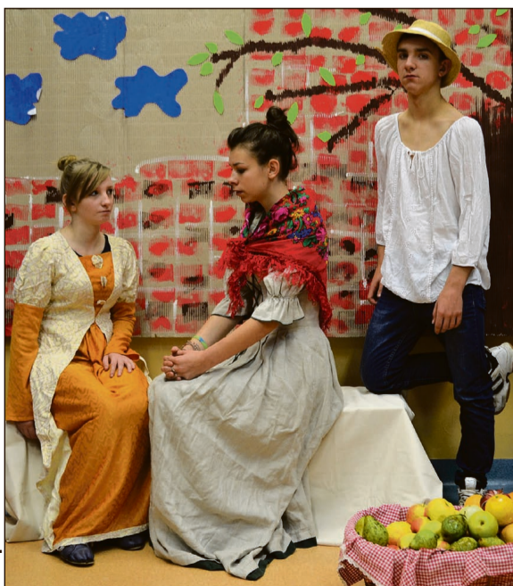
Eugene de Blaas Flirt