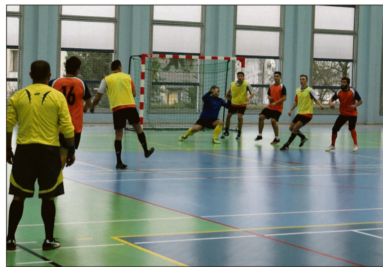
Jeden z meczy w dniu inauguracji ligi