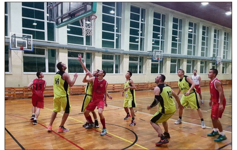
Rio Team w żółto-czarnych strojach

Spotkanie od początku było wyrównane. Po kilku minutach udało nam się uzyskać nieznaczną przewagę, lecz goście konsekwentnie realizowali swoje założenia taktyczne i na przerwę to oni schodzili z 3-punktowym prowadzeniem (35:32). – Nam zabrakło przede wszystkim skuteczności w rzutach z dystansu i półdystansu. Wobec agresywnej i dobrze zorganizowanej obrony wrocławian popełniliśmy także sporo niepotrzebnych błędów w ataku – ocenia złotoryjski koszykarz.