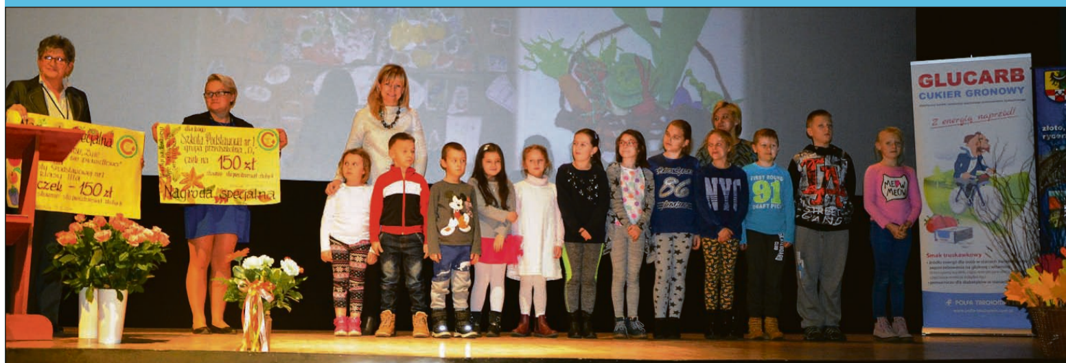
Nagroda specjalna w konkursie plastycznym