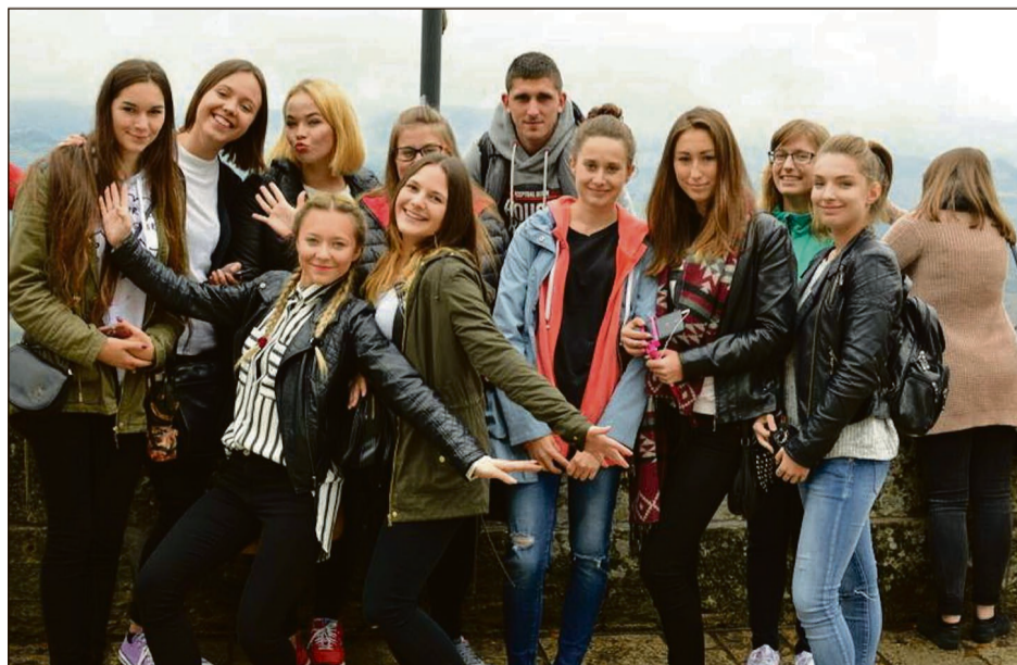
Pamiątkowe zdjęcie podczas jednej z wycieczek