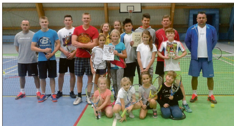
Uczestnicy i organizatorzy turnieju