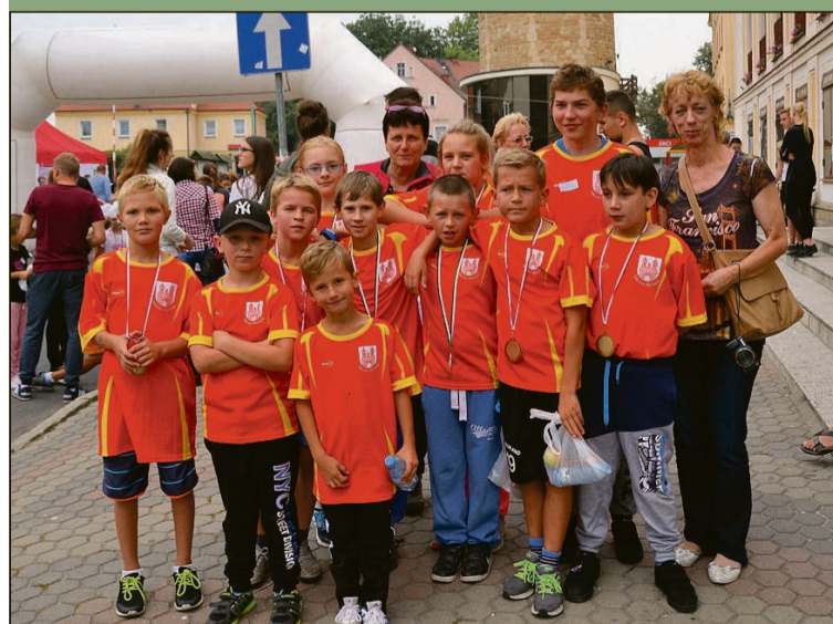
Ekipa sympatycznych zawodników z Mimonia