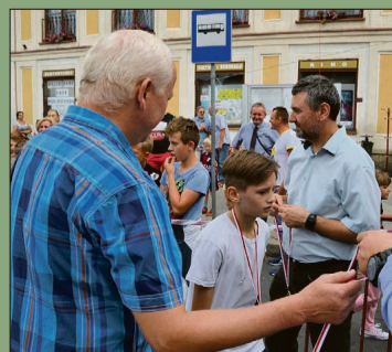
...otrzymał każdy z biegaczy