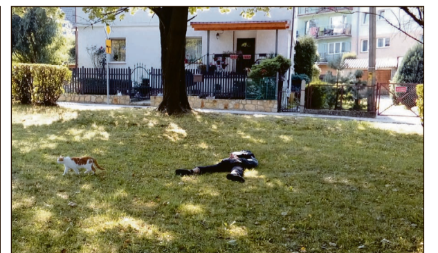
...i skutki podpalacz