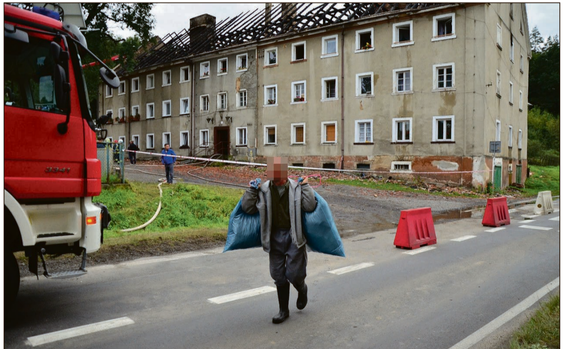
Jak dowiedzieliśmy się wczoraj przed wydaniem gazety, powiatowy inspektor nadzoru budowlanego zabronił użytkowania budynku

Przyczyny pożaru ustalą biegli. Wiadomo, że na strychu nie było