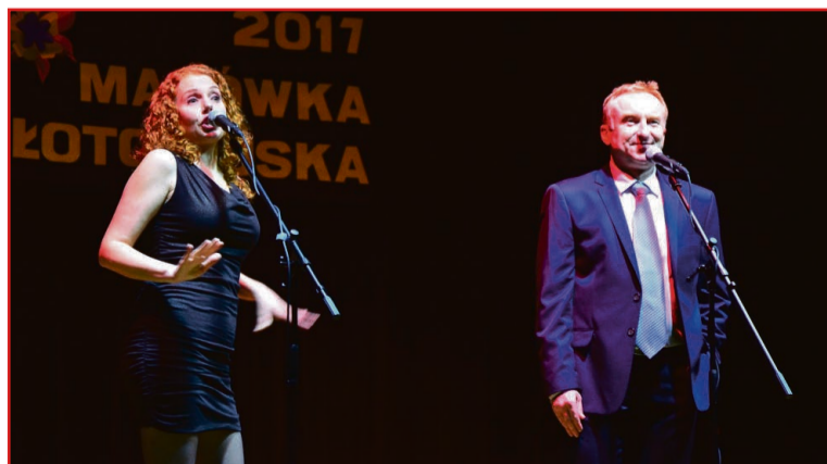
Aktorzy Teatru im. Norwida w Jeleniej Górze