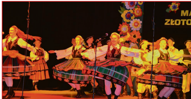
Zespół Pieśni i Tańca „Wrocław”