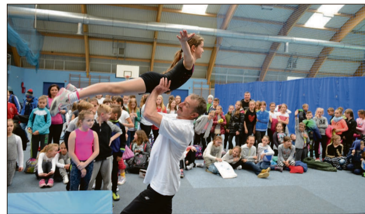
W treningu skoczków chętnie uczestniczyli nasi uczniowie