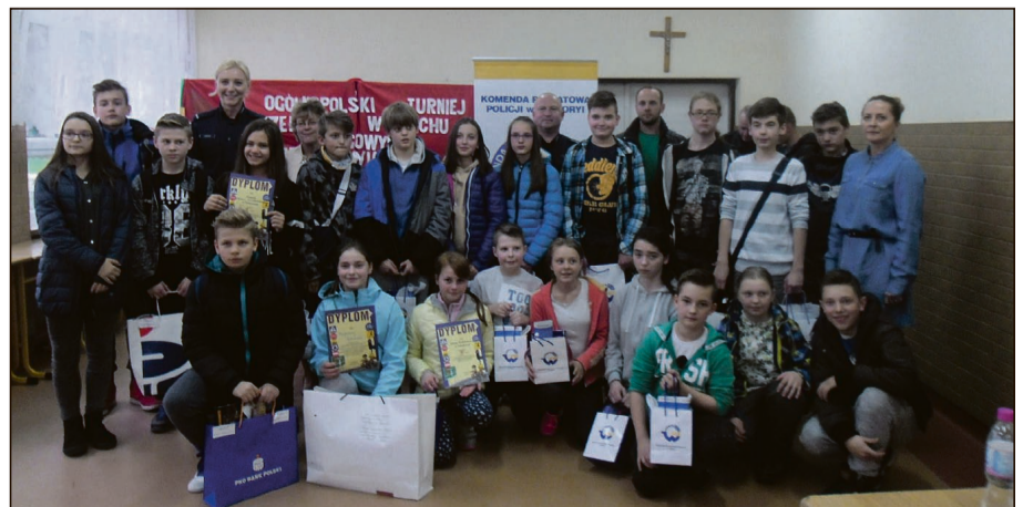
Uczestnicy i organizatorzy eliminacji powiatowych