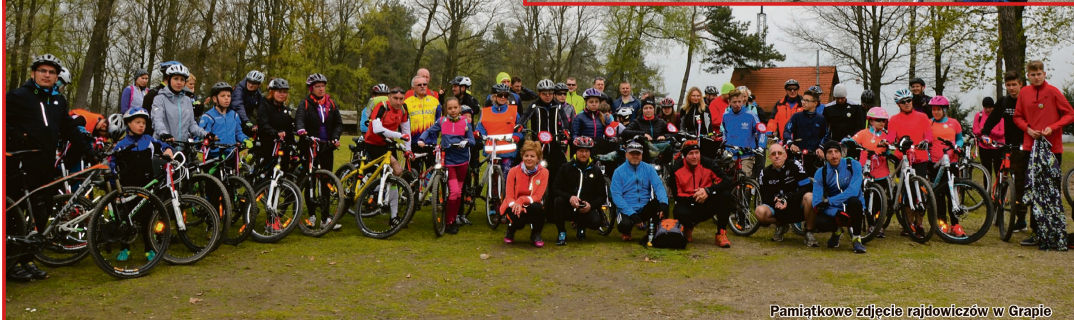
Pamiętkowe zdjęcie rajdowców w Grapie