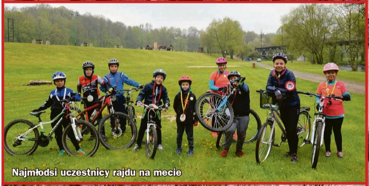
Najmłodszy uczestnicy rajdu na mecie