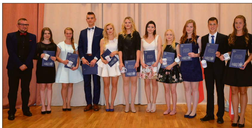
Najlepsi absolwenci z IIIa...