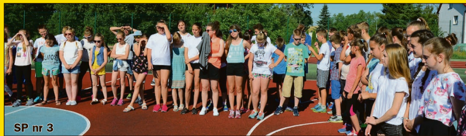
SP nr 3