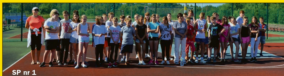
SP nr 1