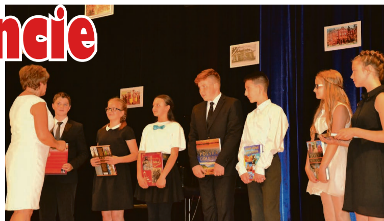
Uczniowie wyróżnieni za bardzo dobrą naukę, zachowanie i reprezentowanie szkoły w konkursach i zawodach sportowych