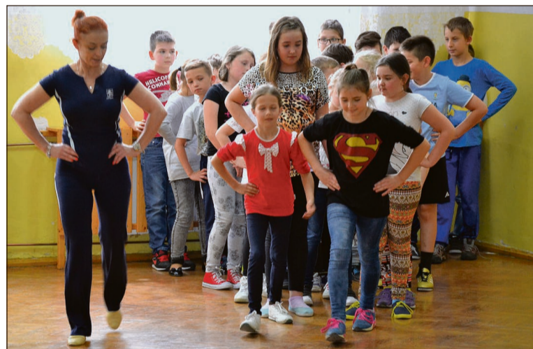
Tańce, których dzieci nauczyły się podczas warsztatów, mają być zaprezentowane na apelu z okazji zakończenia roku szkolnego