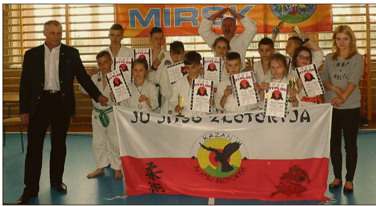
Złotoryjscy judocy z kadrami trenerską