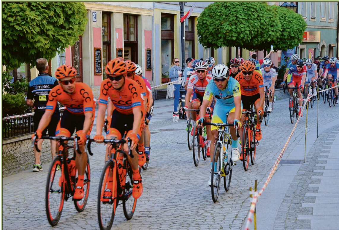
Spokojny przejazd ulicą Basztową

Przez Złotoryję ponownie, i to kilkakrotnie, przemknęli niczym błyskawica kolarze startujący w pierwszym etapie Wyścigu Szlakiem Grodów Piastowskich. Od wielu lat etap, w którym nasze miasto stanowi start lub metę, nazywany jest „książęcym”.