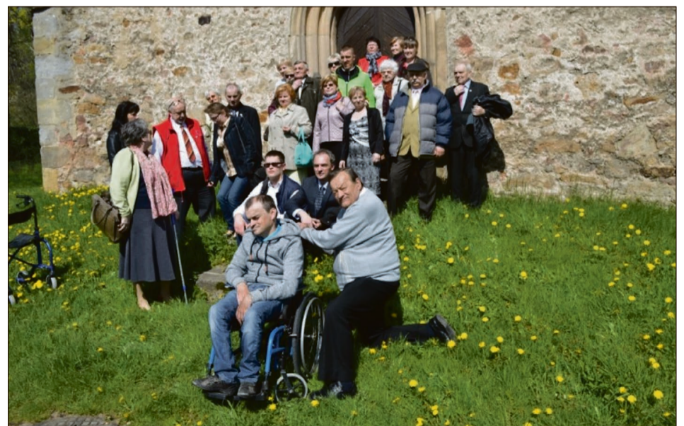
Uczestnicy obchodów jubileuszu