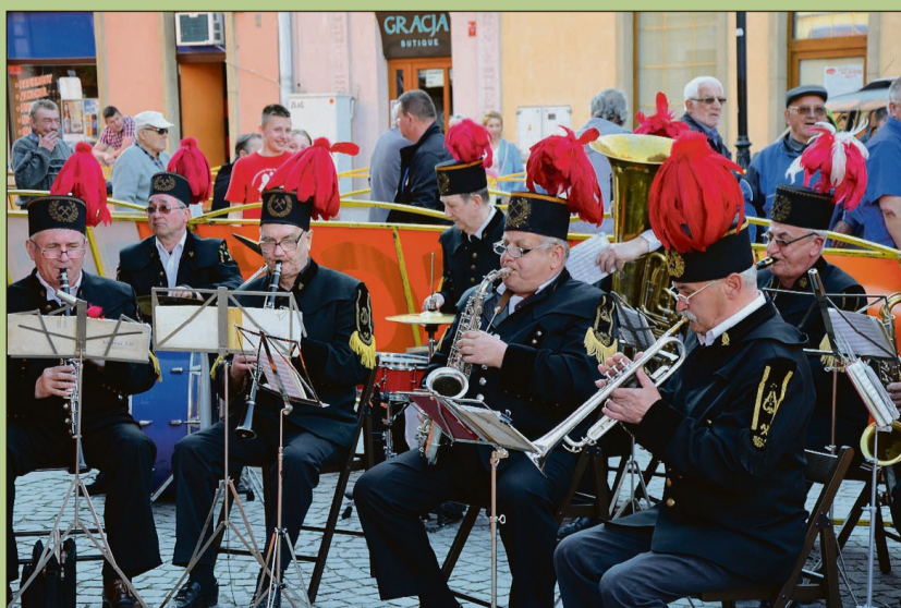
Złotoryjska orkiestra górnicza umiała widzom czas w oczekiwaniu na kolarzy