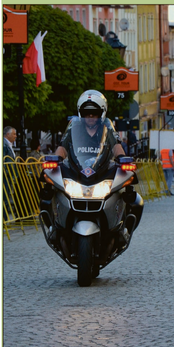
Motocykl policyjny zwiastujący przyjazd pierwszych kolarzy na metę