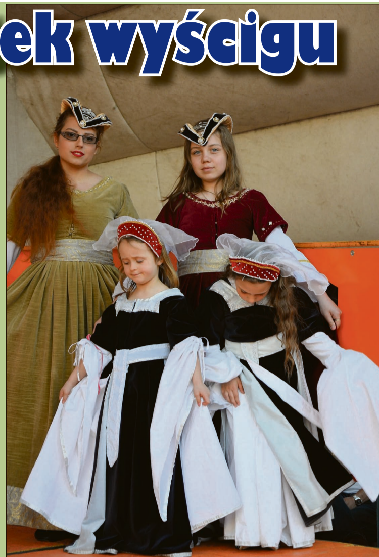
Dziewczęta w średniowiecznych strojach

Tym razem zawodnicy gnali w stronę Złotoryi z Chojnowa. Był to najdłuższy, liczący ponad 185 km etap. Złotoryjanie kibicowali kolarzom głównie na mecie, około godziny 18.30. Jednak szum mknących po asfalcie setek kół można było usłyszeć w naszym mieście o wiele wcześniej. Ok. godz. 17, czyli 3 godziny po starcie w Chojnowie, zawodnicy po raz pierwszy przejechali przez złotoryjski Rynek. Pół godziny później pojawili się tam ponownie, na lotnej premii. Ponad 120 kolarzy mogli także obserwować mieszkańcy Jerzmanic-Zdroju, gdzie najlepsi walczyli o premie górskie.