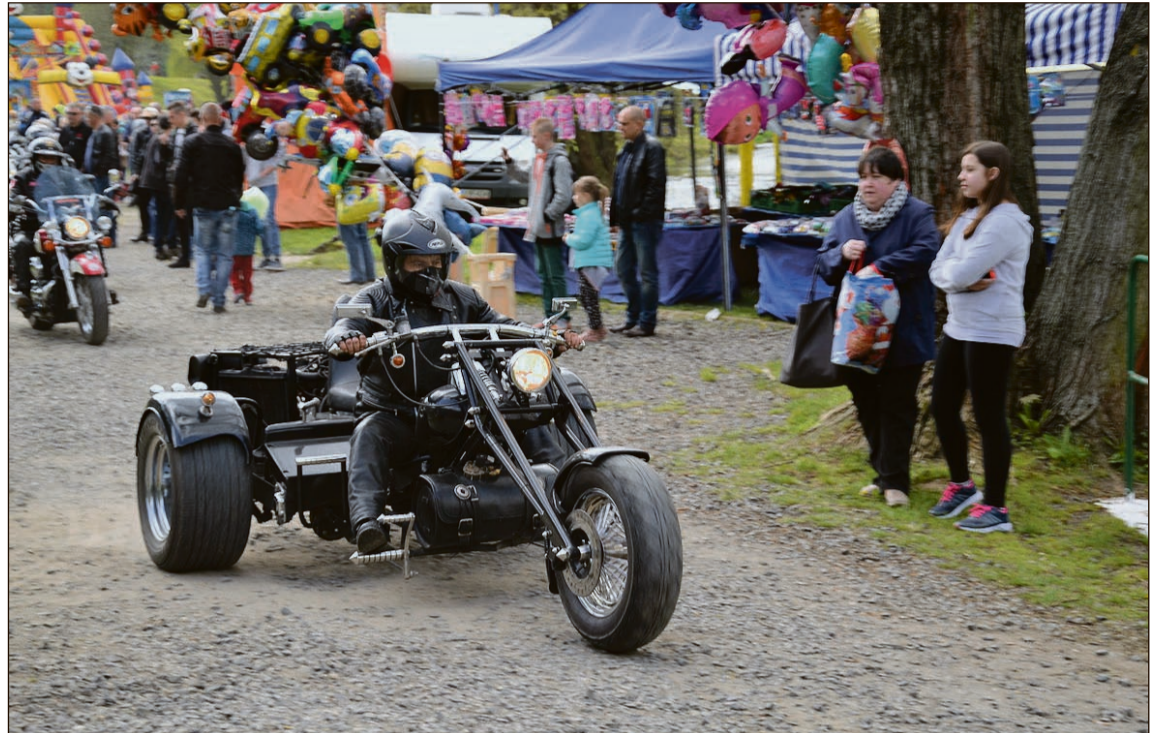
Zmotoryzowani uczestnicy Moto Szol, aby wyjechać z terenu zalewu, musieli przejechać ulicą Sportową – i łamali kodeks drogowy

której Złota Cooltura nie otrzymała. Stowarzyszenie nie złożyło także w Urzędzie Miejskim w