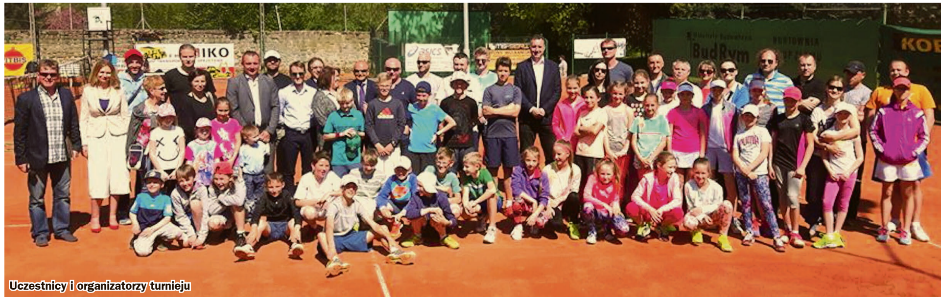
Uczestnicy i organizatorzy turnieju