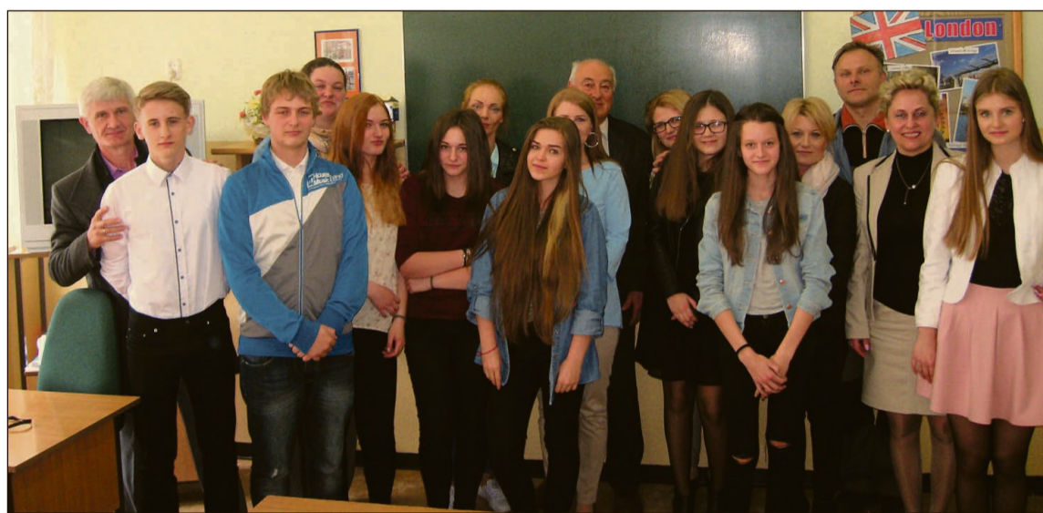
Stypendiści z dumnymi rodzicami