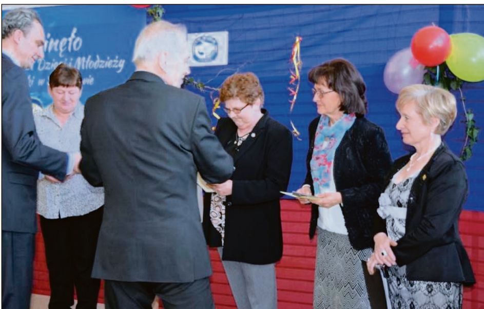
Wyróżnienia dla działaczy z terenu gminy Świerzawy