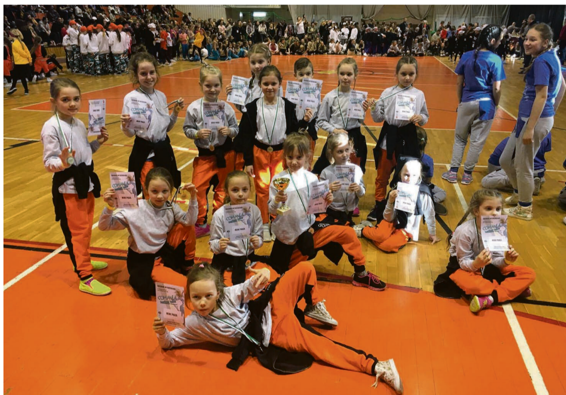
Jedna z formacji Trood