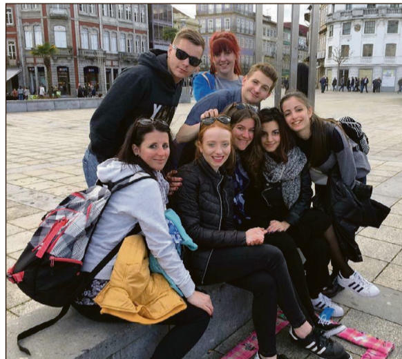
Nasze Rio w Portugalii

happeningu pt. „Stop przemocy”, przez poczynania na rzecz osób niewidomych w Rumunii, aż do szeroko pojętych akcji wolontariackich dla aktywistów z Europy, węgierskiego stowarzyszenia „YUPI” (które było inicjatorem przedsięwzięcia). Całe wydarzenie miało wymiar interkulturowej integracji. Uczestnicy mieli okazję zacieśnić ze sobą więzi podczas licznych zadań grupowych przygotowanych przez