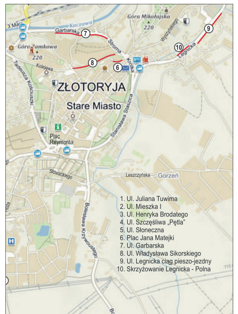
Modernizacja dróg gminnych na terenie miasta Złotoryja ORIENTACJA 1:20 000