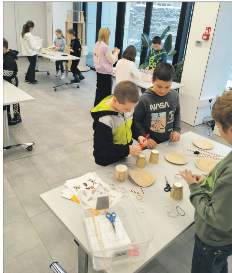
Uczestnicy zajęć projektu SOWA w Miejskiej Bibliotece Publicznej w Bolesławcu, w ramach ferii z ZOK-iem

Projekt zakłada podział ról i kosztów. Kopernik przekazuje każdej placówce wyposażenie, w tym wystawę złożoną z kilkunastu angażujących zwiedzają-