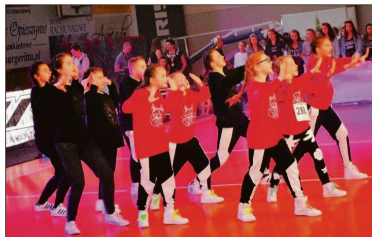
„WOW!” przed i w trakcie występu