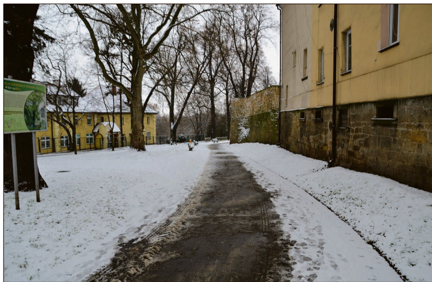
Jak widać na zdjęciu, w naszym mieście służby odpowiedzialne za odśnieżanie działają raczej sprawnie

Należy jednak pamiętać, że żadna firma zajmująca się odśnieżaniem nie jest w stanie usunąć zimy z ulic jak za dotknięciem czarodziejskiej różdżki. W naszym mieście zostały opracowane wytyczne, zgodnie z którymi działa RPK. Złotoryjskie drogi posiadają 3 standardy zimowego utrzymania. Pierwszy, najwyższy, stosowany jest na tych odcinkach, na których są bardziej strome podjazdy (chodzi m.in. o ulice: Kościuszki, Kolejową, Hożą, którą jeżdżą do szpitala karetki pogotowia, Górnica, Słowackiego, Szpitalną itp.) oraz na ciągach komunikacyjnych prowadzących do szkół i przedszkoli. W drugiej kolejności odśnieżane są płaskie odcinki dróg w centrum miasta, a następnie na obrzeżach. Na końcu pługi jadą na drogi szutrowe. – Z rozpoczęciem akcji odśnieżania i posypywania piachem zawsze czekamy na sygnał z Urzędu Miejskiego w Złotoryi, który jest