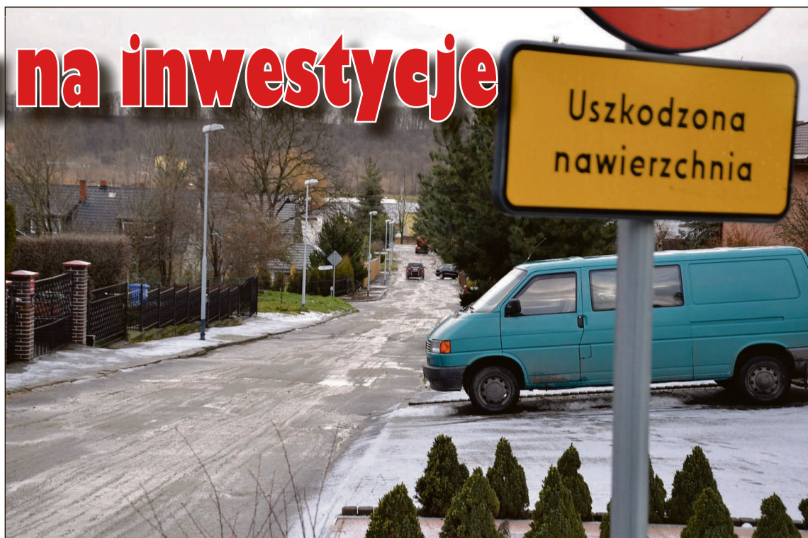
W planie inwestycji na ten rok jest modernizacja uszkodzonej nawierzchnia na ul. Gwarków

Większość wydatków w budżecie miejskim, oszacowanym na 66 mln 542 tys. zł, to jednak wydatki bieżące. Wśród nich po raz pierwszy najwięcej pieniędzy pochłonie nie oświata, lecz pomoc społeczna i wsparcie rodziny, na które miasto wyda 15,8 mln zł. Zaznaczyć jednak trzeba, że ogromna większość tych środków przekazana będzie przez rząd w formie dotacji celowych z budżetu państwa. Ten wzrost w stosunku do ubiegłego roku wiąże się przede wszystkim z wpro-