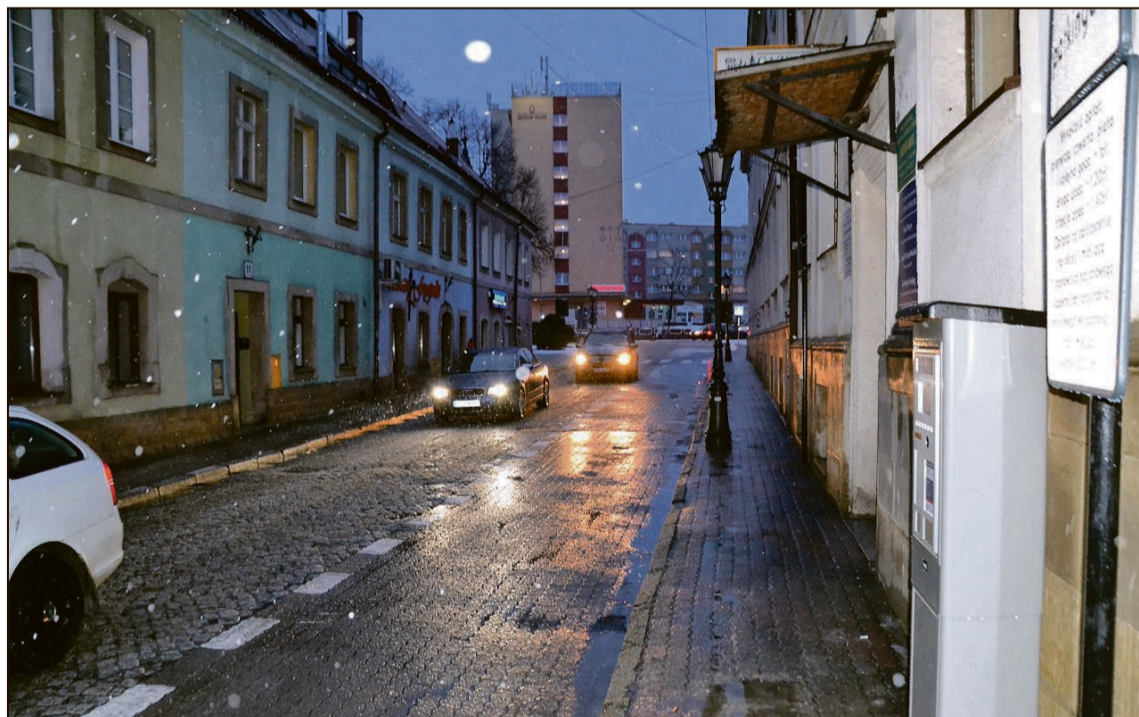
Puste parkingi kwadrans przed 8 mogą świadczyć o tym, że wcześniej pozostawiali tu swoje auta kierowcy, którzy następnie szli na cały dzień do pracy

Najbardziej zadowoleni są przedsiębiorcy, których sklepy czy też punkty usługowe zlokalizowane są w rejonie płatnych stref. – Dzięki temu, że parkingi nie są przepełnione, nasi klienci mają gdzie się zatrzymać i ich rotacja jest zauważalnie większa.