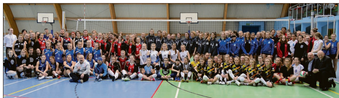
Uczestnicy i organizatorzy turnieju