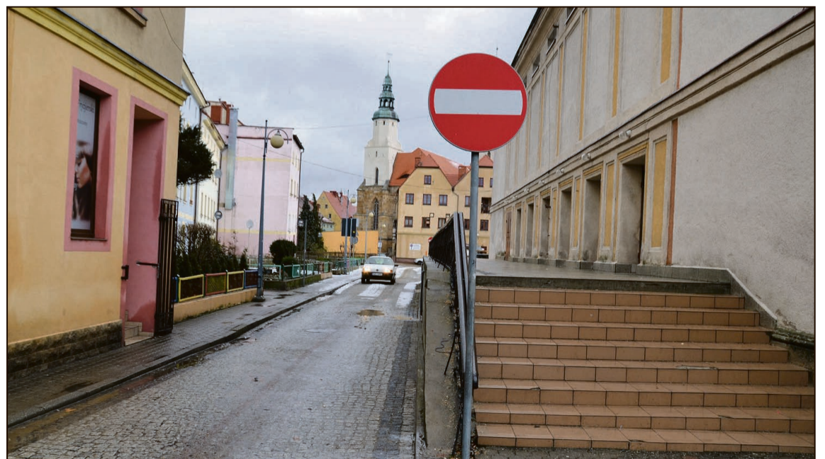
Uwaga – na parking za ZOKiR-em nie wjeżdżamy już od strony Baszty Kowalskiej

się do konieczności płacenia za parkowanie na Żeromskiego i Bohaterów Getta Warszawskiego, przypominając o konieczności zakupu biletu.