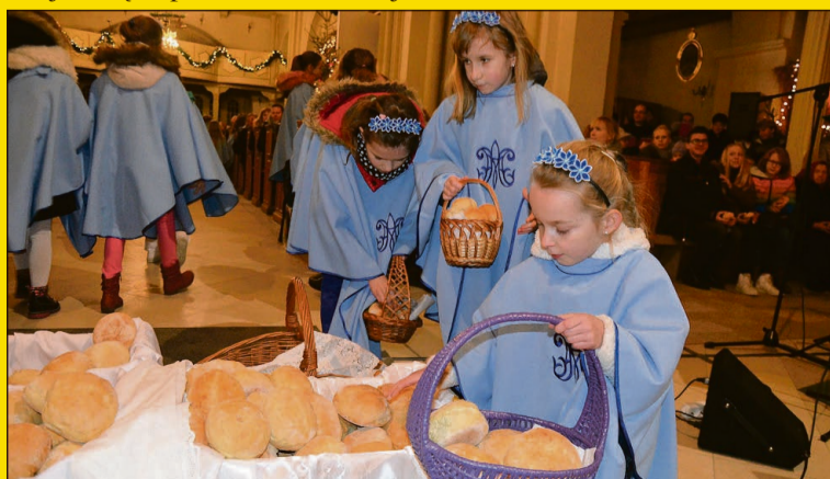
„Chlebkiem miłości” zostali obdarowani wszyscy chętni słuchacze

Sara przeszła 15 cykli chemioterapii, operację wycięcia guza, przeszczep z jej własnych komórek macierzystych i radioterapię. Ostatni etap leczenia to immunoterapia anti-GD2, która będzie trwała od 7 do 12 miesięcy. Koszt leczenia wyniesie 1 mln zł