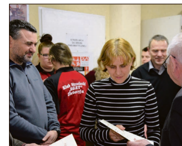
Gratulacje i podziękowania trafiły także na ręce rodziców zawodników