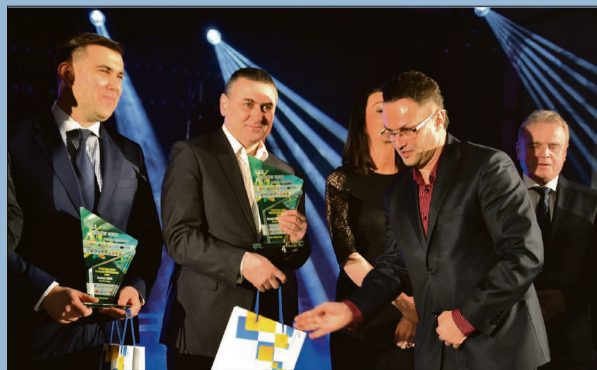
Miasto Złotoryja otrzymało razem z kilkoma samorządami byłego województwa legnickiego tytuł Sportowej Gminy Roku

m.in. przedstawicielom firmy Mine Master z Wilkowa, którą uhonorowano tytułem Mecenasa Sportu Roku 2016. Galę zakończył koncert zespołu Feel. (as)