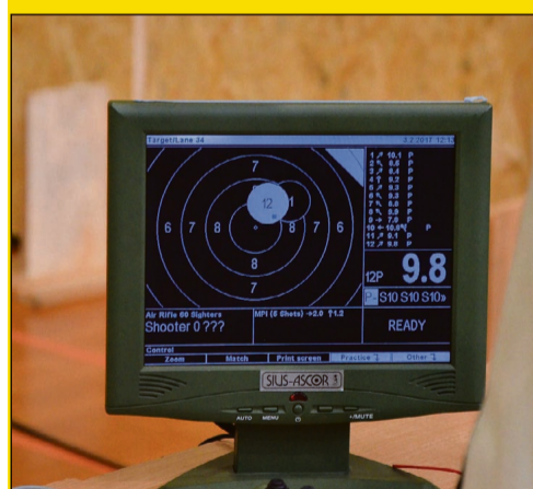
Każdy zawodnik od razu po strzale na monitorze mógł sprawdzić swój wynik. Dodatkowo każdy strzał był drukowany na specjalnej maszynie