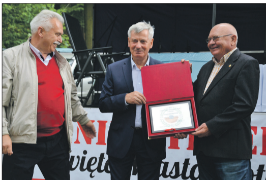
Na uroczystości na strzelnicy przy Legnickiej pojawili się