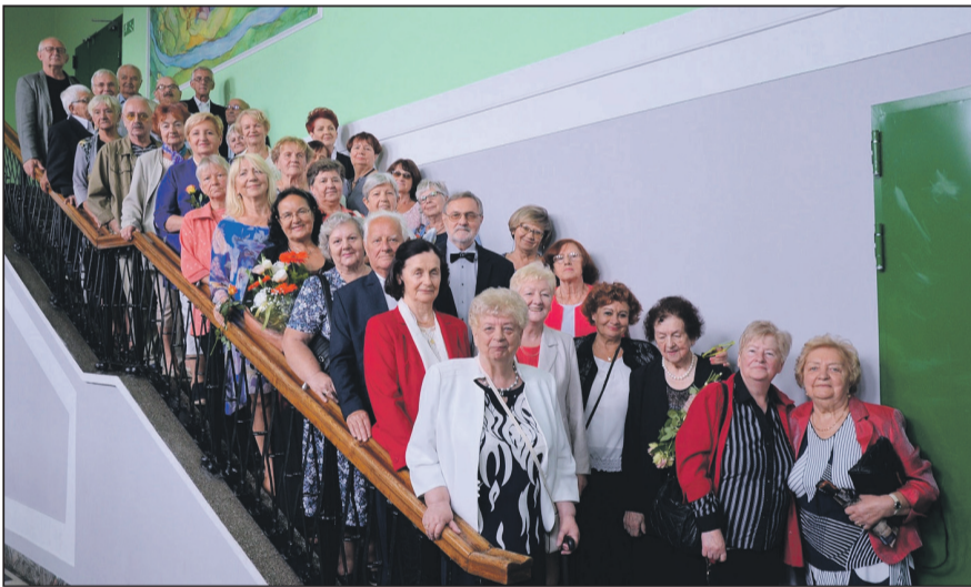
Młodość jest nie tylko fizyczna, ale i wewnętrzna, mentalna – mówił główny prowadzący.

My nadal jesteśmy i piękni, i młodzi, jedynie przybyło nam 50 lat.