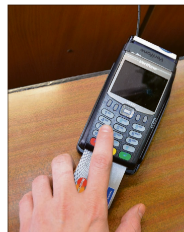
Wczoraj już w pół godziny po zamontowaniu terminalu w USC skorzystało z niego 2 klientów urzędu

Przypomnijmy, że już od kilku miesięcy bezgotówkowo można regulować podatki i opłaty w kasie złotoryjskiego ratusza. Terminal został uruchomiony w październiku 2016 r. Za pomocą kart płatniczych w magistracie można opłacać m.in. podatek od nieruchomości czy transportowy, rolno, opłaty adiacenckie, opłaty za psa, mandaty, dodatkowe opłaty za brak biletu parkingowego.