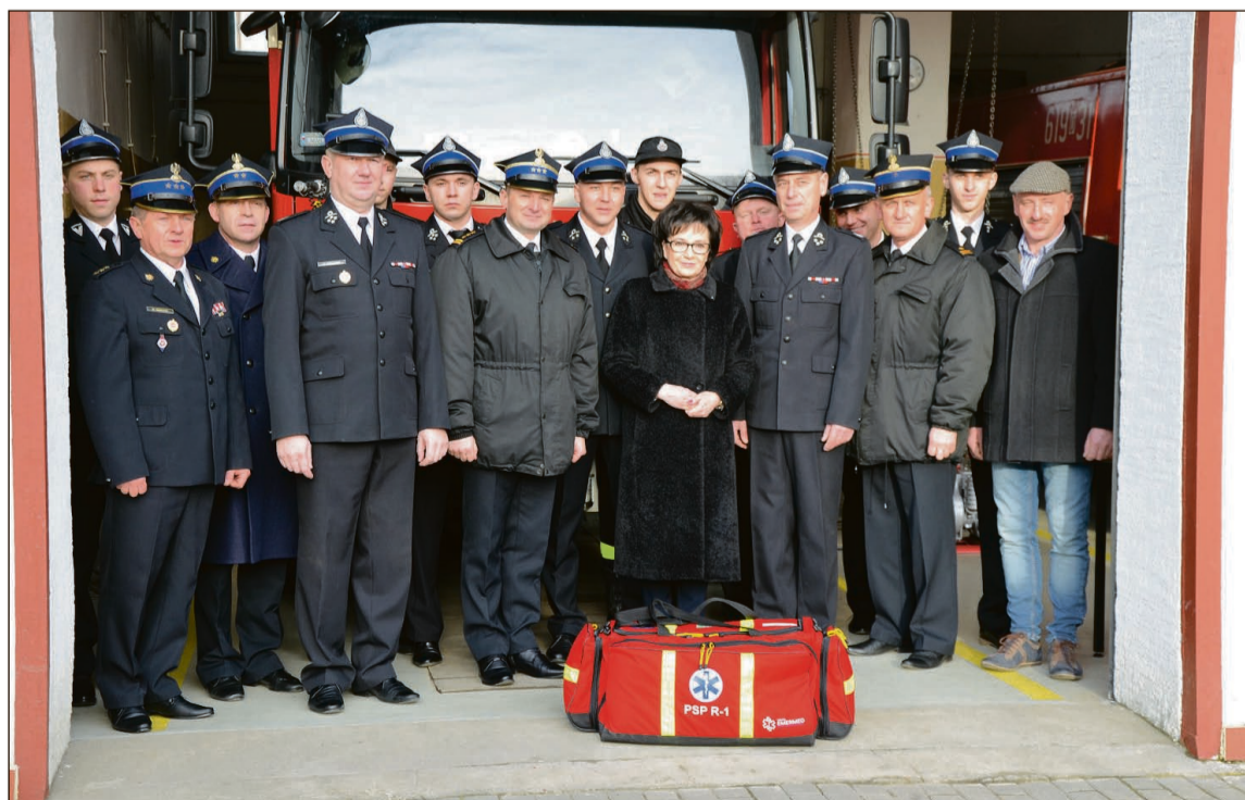
Strażacy na pamiątkowym zdjęciu z posłanką